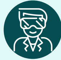
PROTETOR OCULAR OU FACIAL