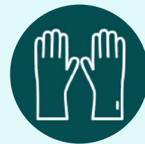
LUVAS DE PROCEDIMENTO